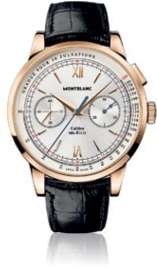
MONTBLANC MEISTERSTÜCK HERITAGE Pulsograph