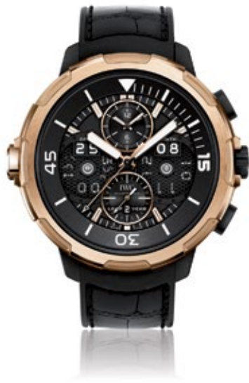
IWC AQUATIMER Perpetual Calendar Digital Date-Month