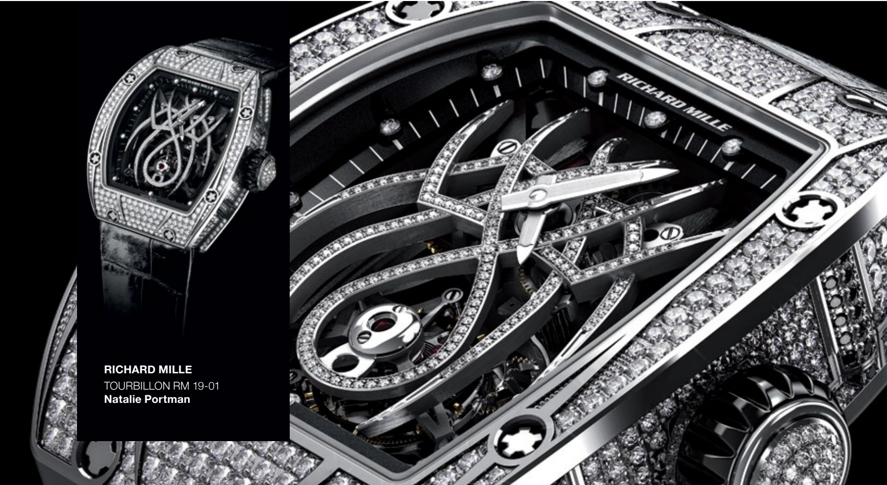
RICHARD MILLE TOURBILLON RM 19-01 Natalie Portman