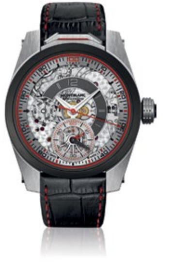
MONTBLANC TIMEWALKER Chronograph 100