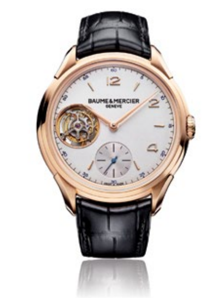
BAUME & MERCIER CLIFTON 1892 Flying Tourbillon