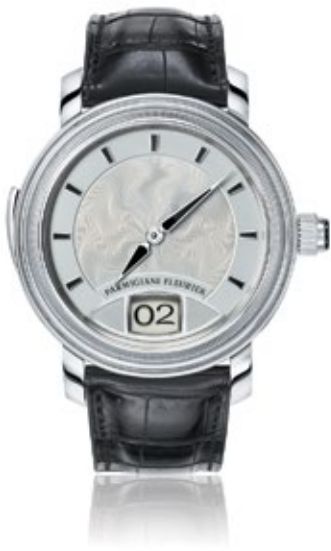
PARMIGIANI FLEURIER TORIC Resonance 3