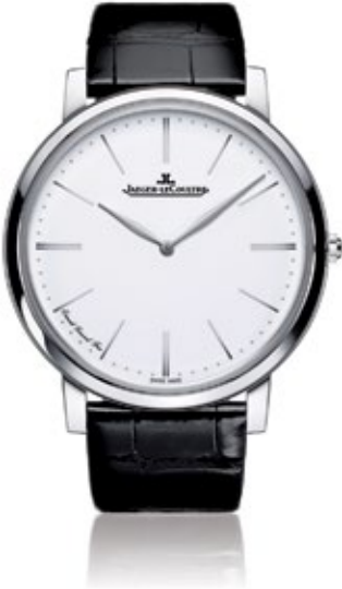
JAEGER-LECOULTRE MASTER ULTRA THIN Master Ultra Thin Grand Feu