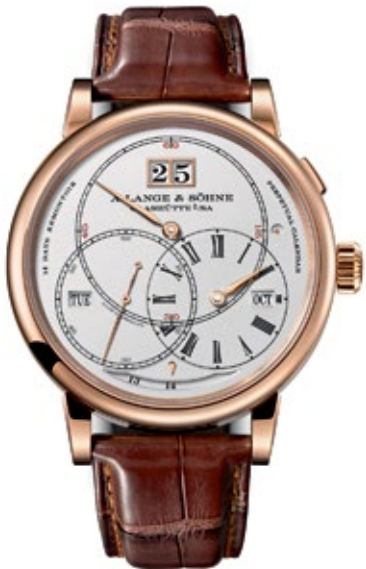
A.LANGE & SÖHNE RICHARD LANGE Perpetual Calendar Terraluna