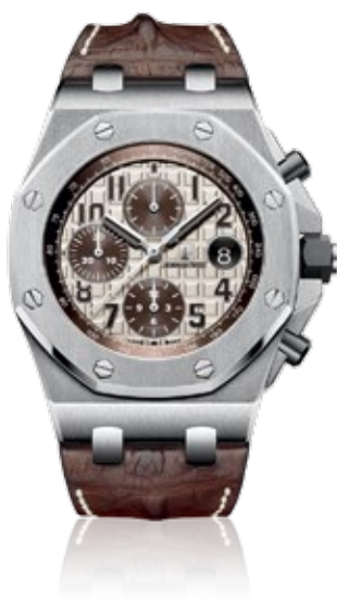
AUDEMARS PIGUET ROYAL OAK OFFSHORE Chronograph 42mm