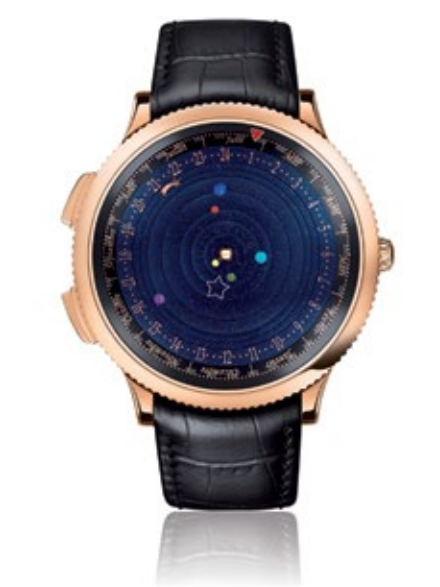
VAN CLEEF & ARPELS POETIC ASTRONOMY Midnight Planétarium