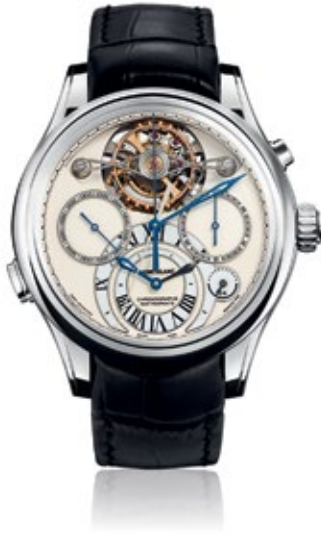
MONTBLANC NICOLAS RIEUSSEC "Homage to Nicolas Rieussec"