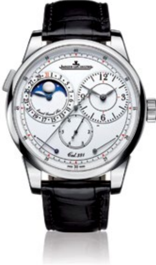
JAEGER-LECOULTRE DUOMÈTRE Duomètre à Quantième Lunaire