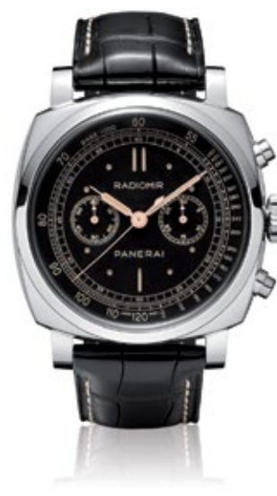
PANERAI RADIOMIR 1940 Chronograph Oro Bianco