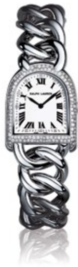
RALPH LAUREN STIRRUP Petite-Link