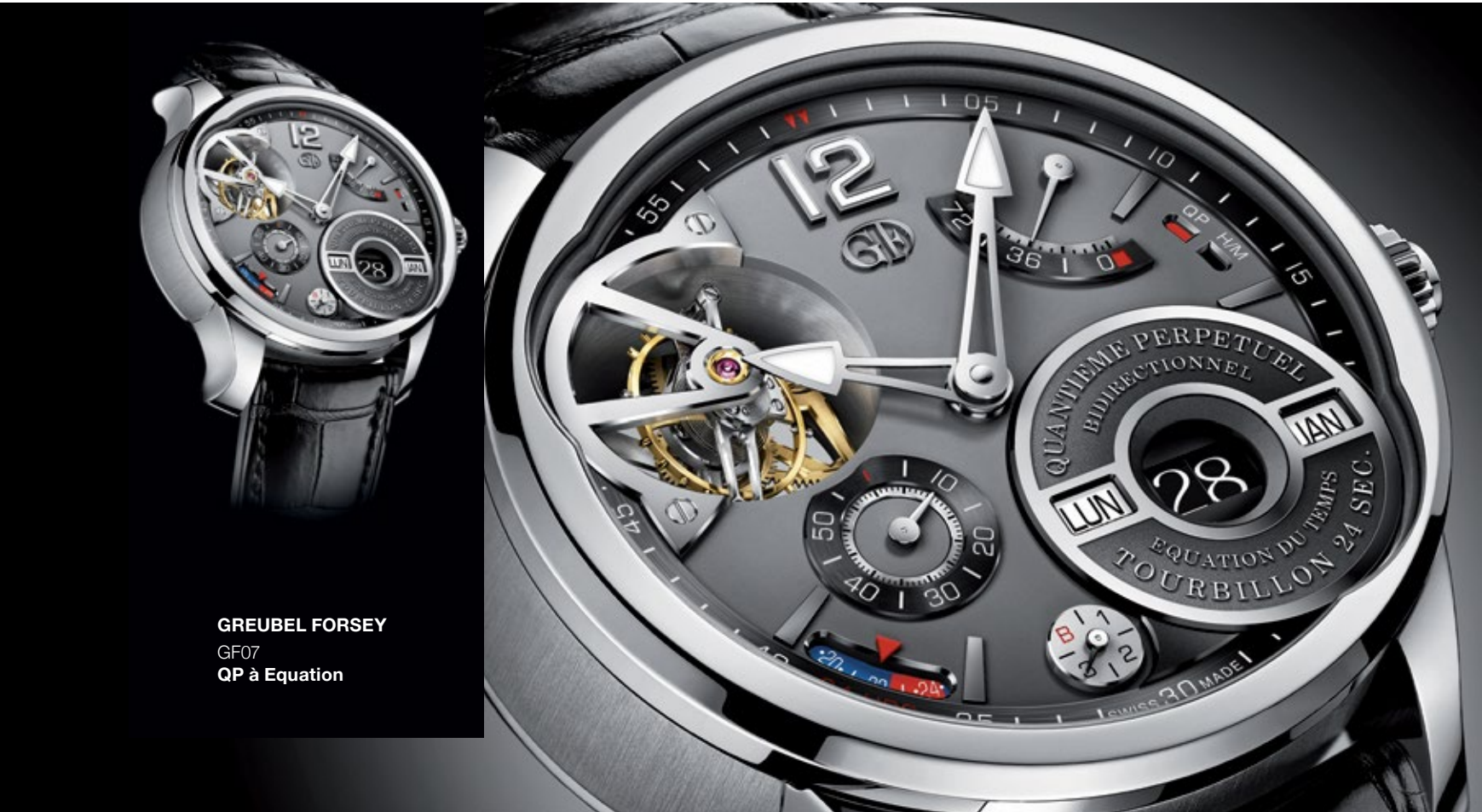
GREUBEL FORSEY GF07 QP à Equation