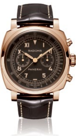
PANERAI RADIOMIR 1940 Chronograph Platina