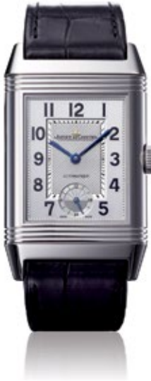
JAEGER-LECOULTRE GRANDE REVERSO Grande Reverso Night & Day