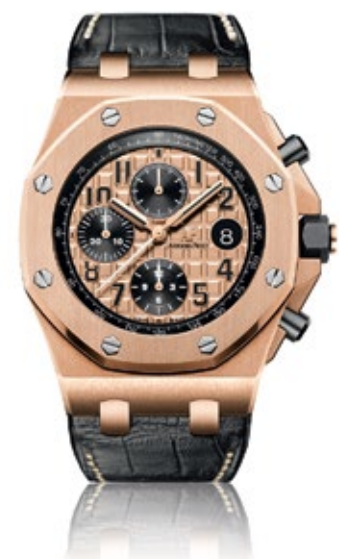
AUDEMARS PIGUET ROYAL OAK OFFSHORE Chronograph 42mm