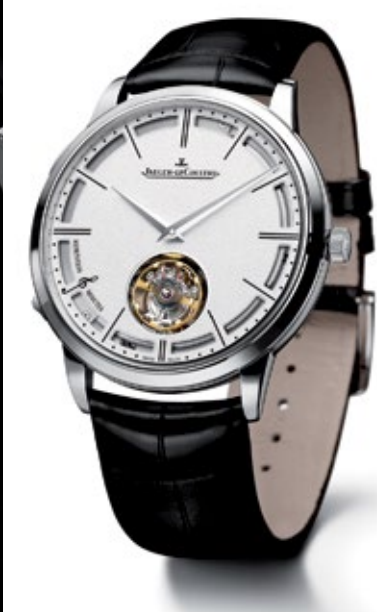
JAEGER-LECOULTRE HYBRIS MECHANICA 11 Master Ultra Thin Minute Repeater Flying Tourbillon