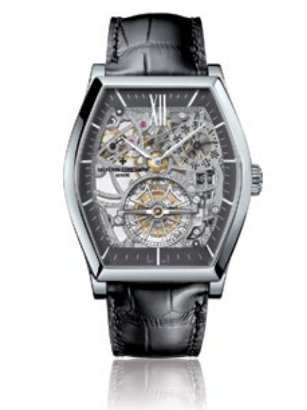
VACHERON CONSTANTIN MALTE Tourbillon Openworked