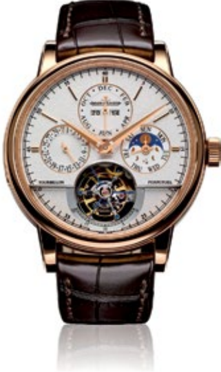
JAEGER-LECOULTRE MASTER GRANDE TRADITION Tourbillon Cylindrique à Quantième Perpétuel