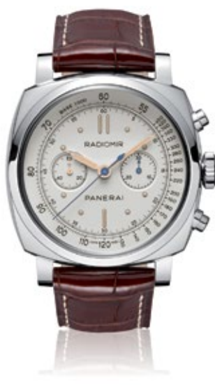
PANERAI RADIOMIR 1940 Chronograph Oro Rosso