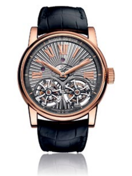
ROGER DUBUIS HOMMAGE Double Flying Tourbillon