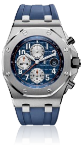
AUDEMARS PIGUET ROYAL OAK OFFSHORE Chronograph 42mm