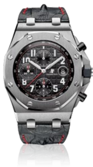
AUDEMARS PIGUET ROYAL OAK OFFSHORE Chronograph 42mm