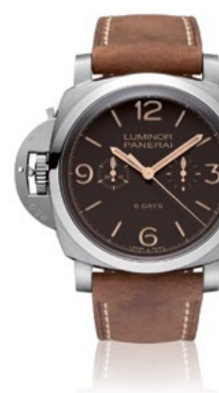
PANERAI LUMINOR 1950 Chrono Monopulsante Left-Handed 8 Days Tit nio