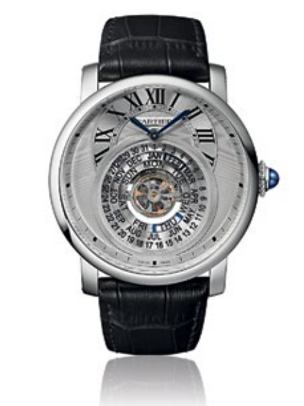
CARTIER ROTONDE DE CARTIER Astrocalendaire