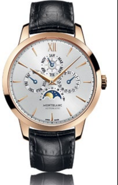
MONTBLANC MEISTERSTÜCK HERITAGE Perpetual Calendar