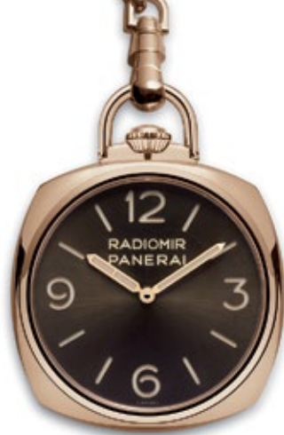
PANERAI POCKET WATCH 3 Days Oro Rosso