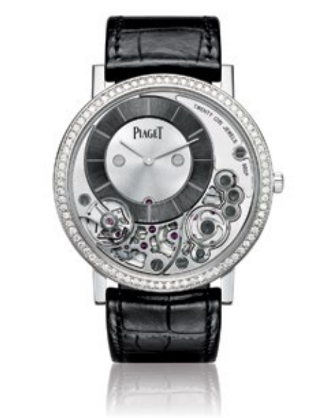
PIAGET ALTIPLANO Altiplano 38mm 900P