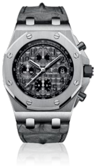
AUDEMARS PIGUET ROYAL OAK OFFSHORE Chronograph 42mm