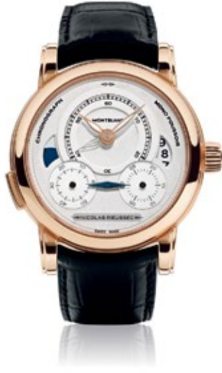
MONTBLANC COLLECTION VILLERET 1858 ExoTourbillon Rattrapante