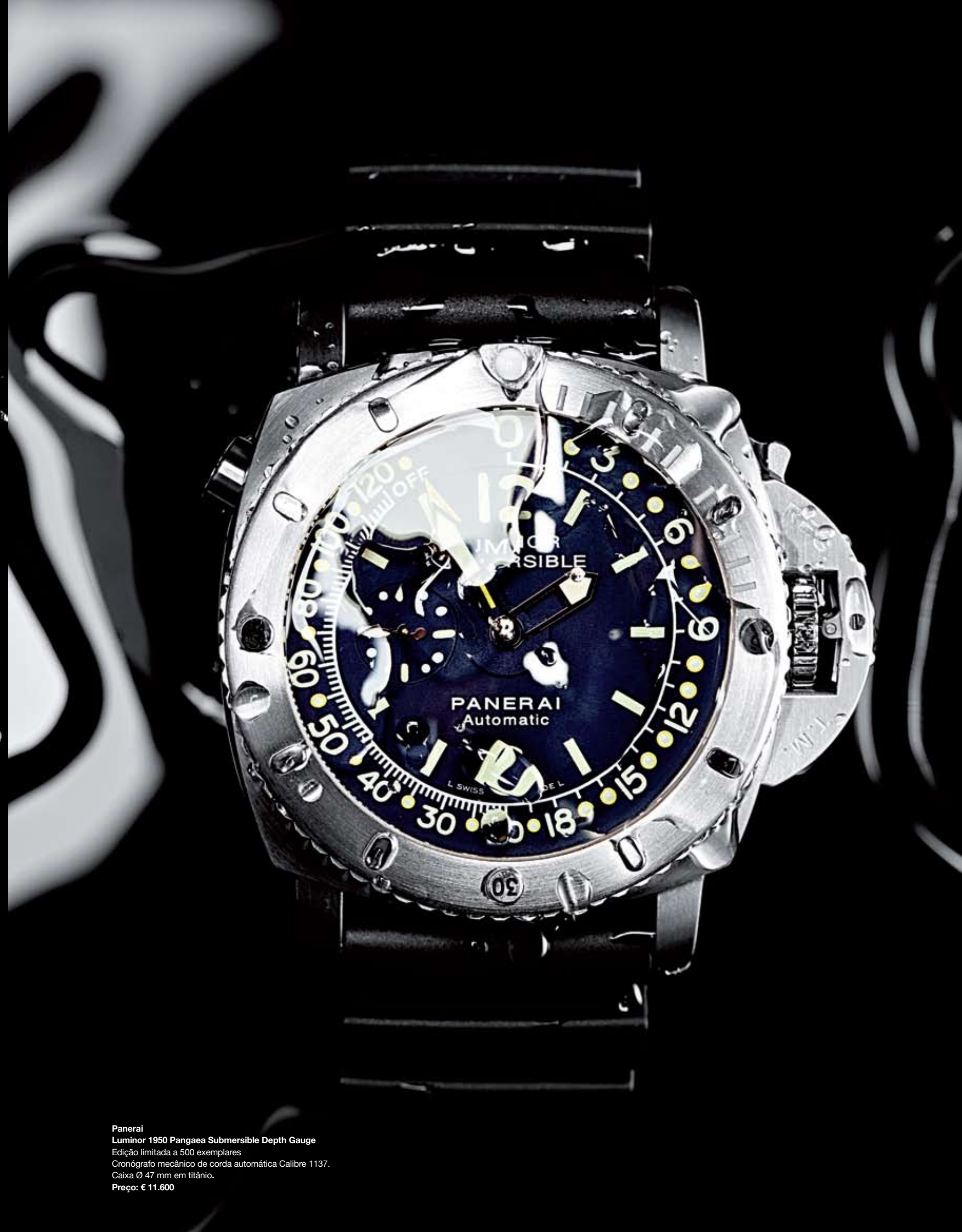
Panerai Luminor 1950 Pangaea Submersible Depth Gauge Edição limitada a 500 exemplares Cronógrafo mecânico de corda automática Calibre 1137. Caixa Ø 47 mm em titânio. Preço: € 11.600