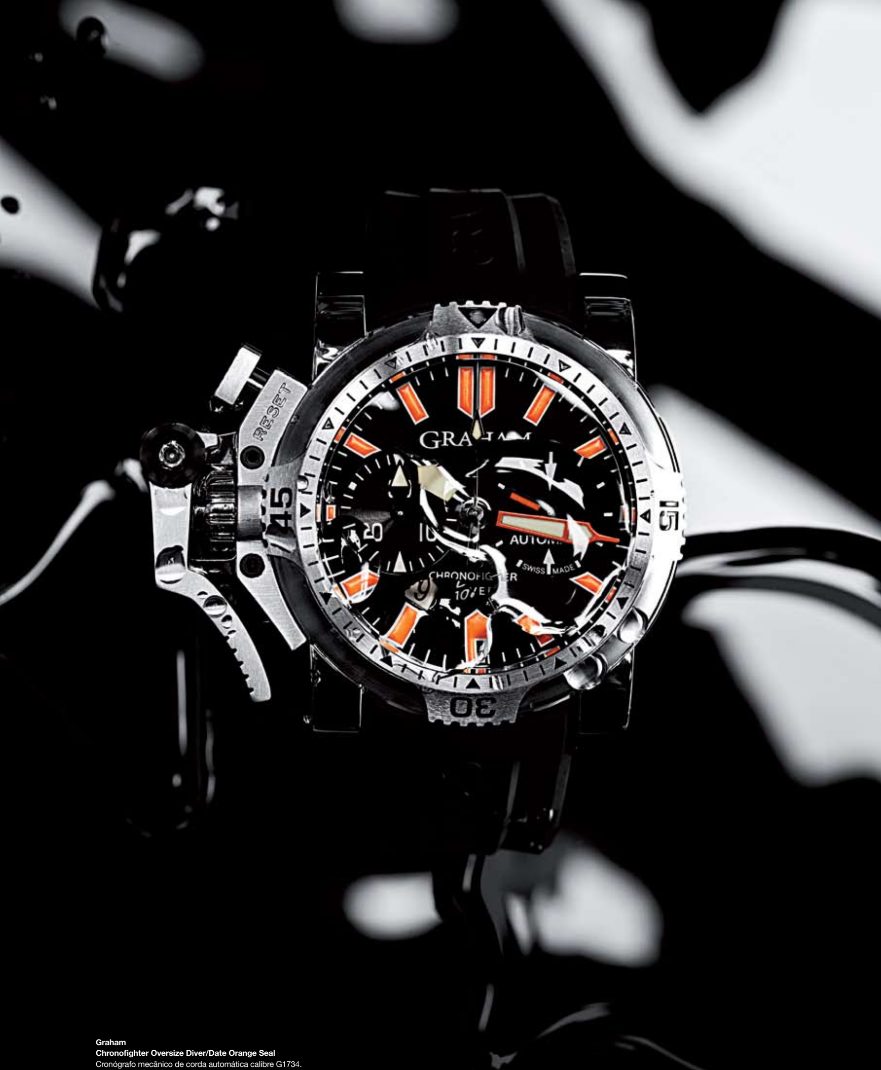
Graham Chronofighter Oversize Diver/Date Orange Seal Cronógrafo mecânico de corda automática calibre G1734. Caixa Ø 47 mm em aço estanque até 300 metros. Preço: € 6.350