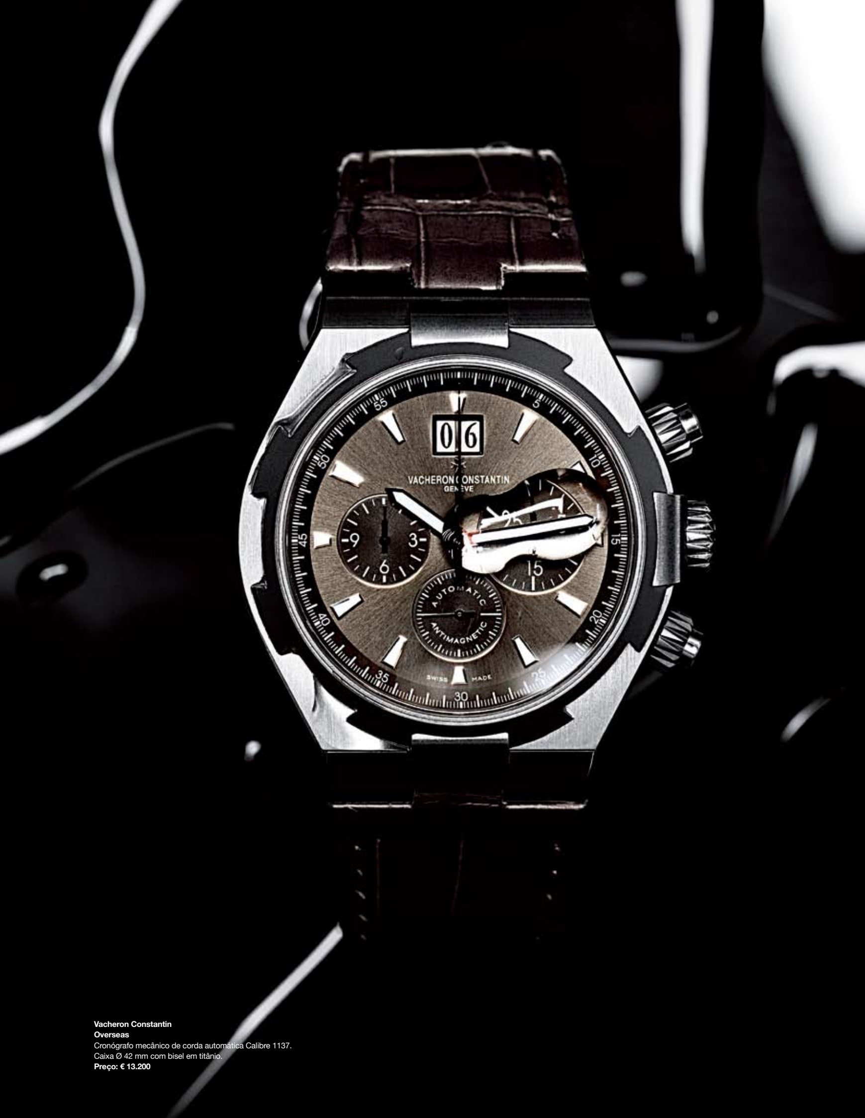
Vacheron Constantin Overseas Cronógrafo mecânico de corda automática Calibre 1137. Caixa Ø 42 mm com bisel em titânio. Preço: € 13.200