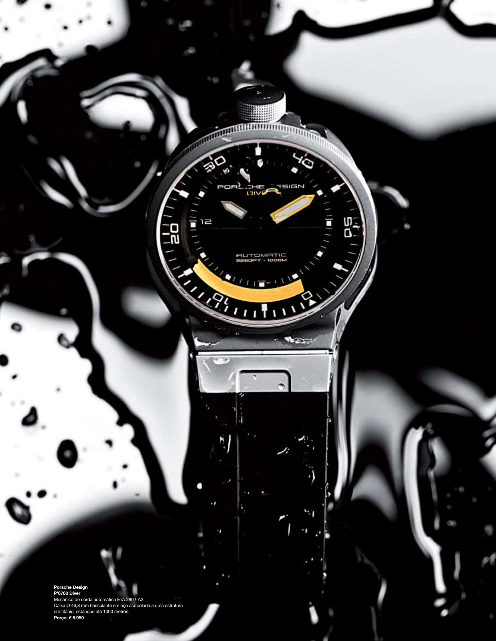
Porsche Design P'6780 Diver Mecânico de corda automática ETA 2892-A2. Caixa Ø 46,8 mm basculante em aço acoplada a uma estrutura em titânio, estanque até 1000 metros. Preço: € 6.950