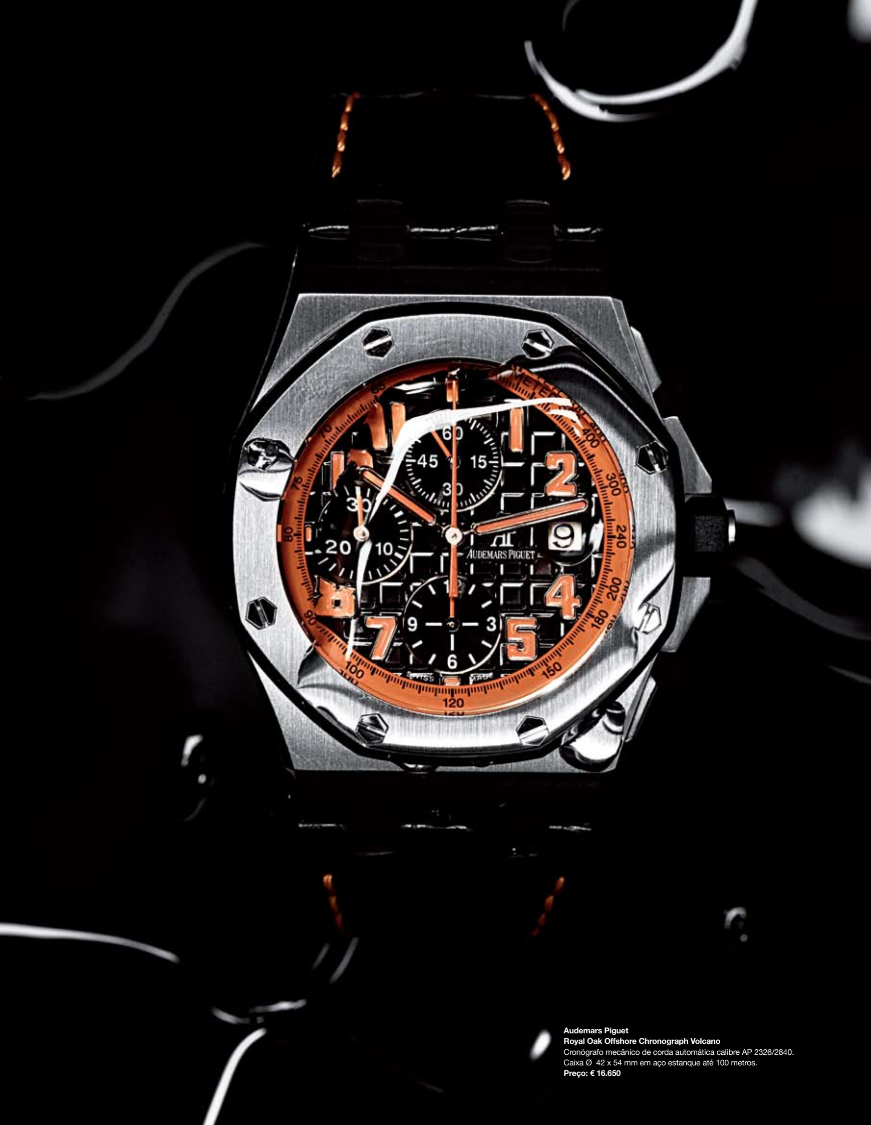
Audemars Piguet Royal Oak Offshore Chronograph Volcano Cronógrafo mecânico de corda automática calibre AP 2326/2840. Caixa Ø 42 x 54 mm em aço estanque até 100 metros. Preço: € 16.650