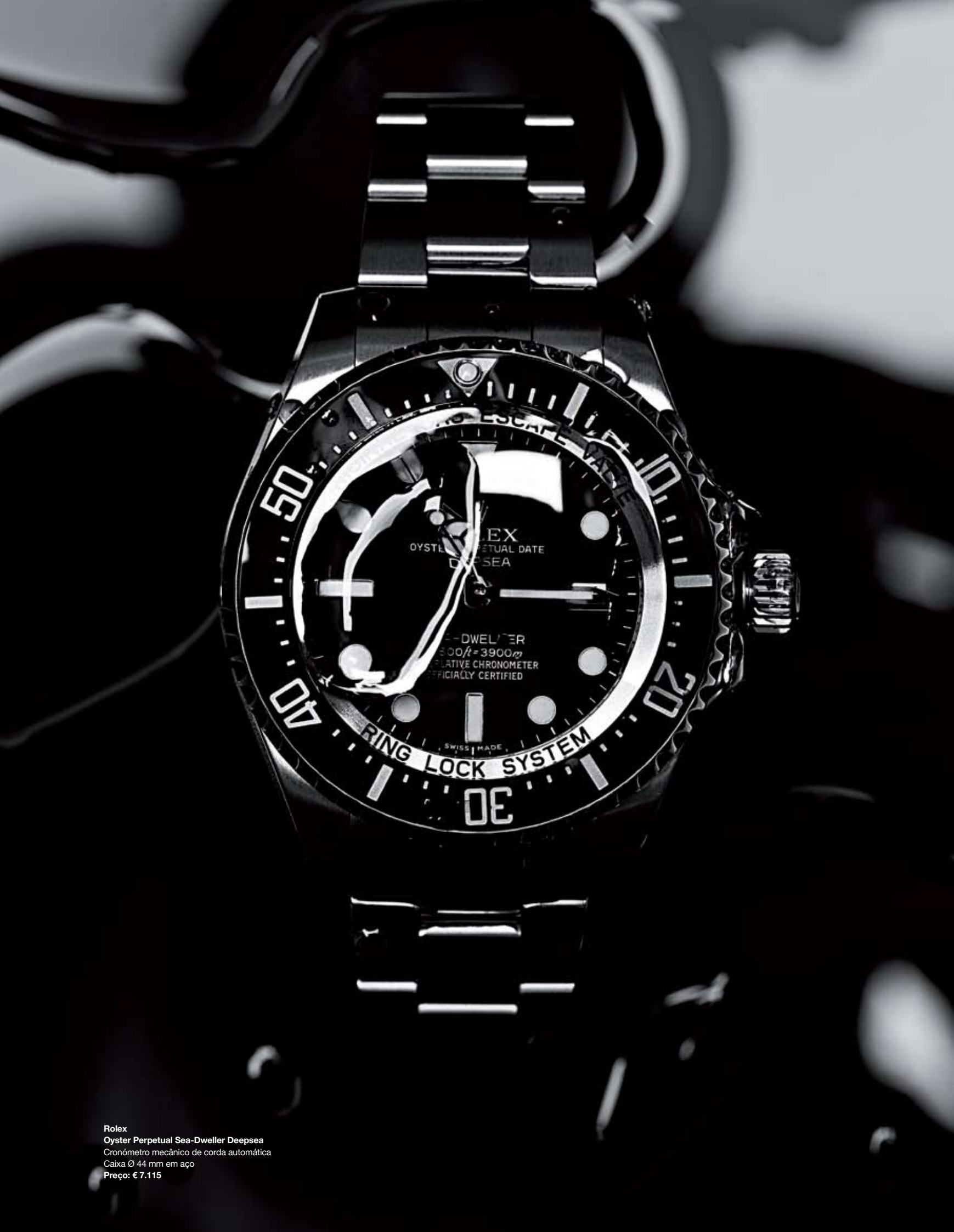
Rolex Oyster Perpetual Sea-Dweller Deepsea Cronómetro mecânico de corda automática Caixa Ø 44 mm em aço Preço: € 7.115