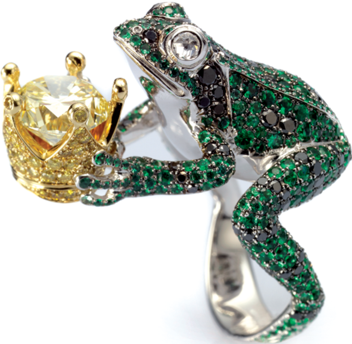
Frog Ring Anel em forma de sapo em ouro cravejado com esmeraldas (3cts), diamantes pretos e brancos, que segura uma coroa que ostenta um diamante amarelo de corte brilhante (3cts) inteiramente rodeado por diamantes amarelos.