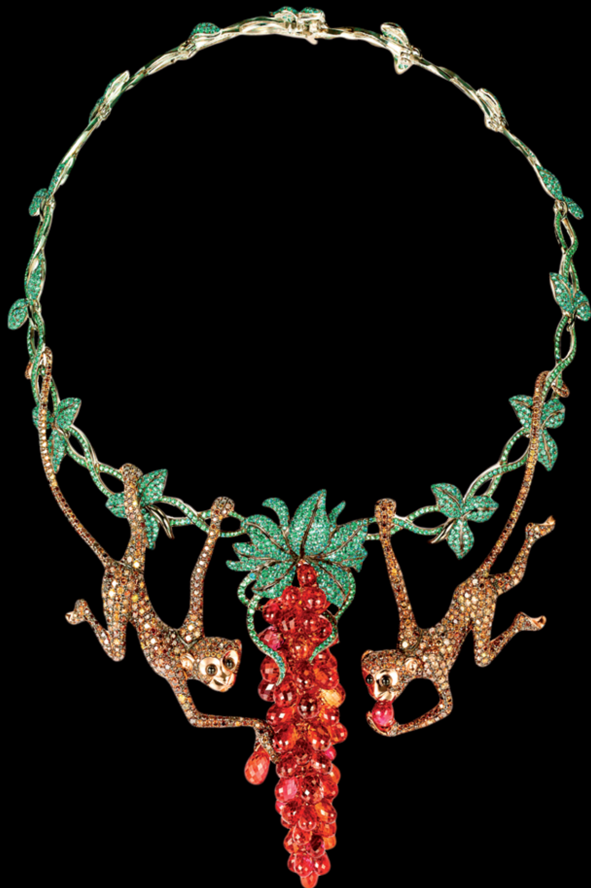
Monkey Pendant Gargantilha pendente em ouro branco cravejado com diamantes castanhos (5cts) e tsavoritas (5cts), num colar em ouro branco cravejado com rubelitas em corte briollett (16cts).