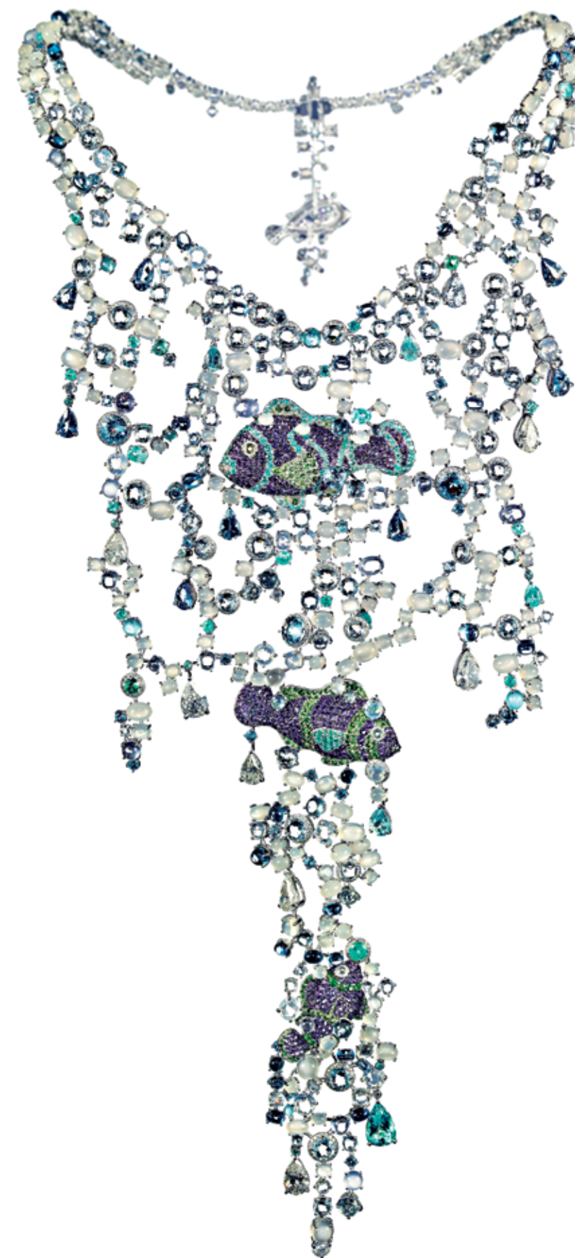
Clownfish Plastron Necklace Colar com peixes palhaço em ouro branco cravejado com pedras lua (105cts), águas-marinhas (38cts), safiras azuis (21cts), safiras em azul pastel, topázios azuis (18cts), quartzo (15cts), turmalina Paraíba (14cts), diamantes (2cts), ametistas (8cts), apatitas (8cts), calcedónias (3cts) e tsavoritas (1ct).