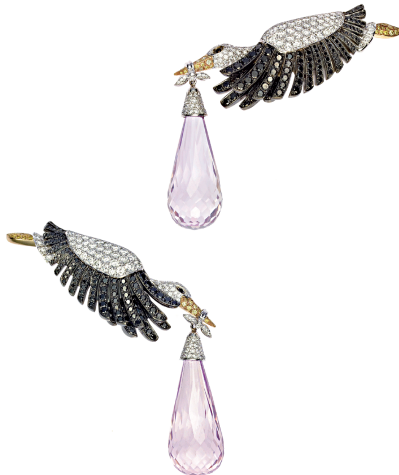
Storks Earrings Brincos em forma de cegonhas em ouro branco e ouro vermelho cravejado com duas kunzitas de corte briollett totalizando 51 ct, bem como diamantes (3cts), diamantes pretos (2cts) e diamantes amarelos.